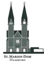
ST. MARIEN-DOM HAMBURG